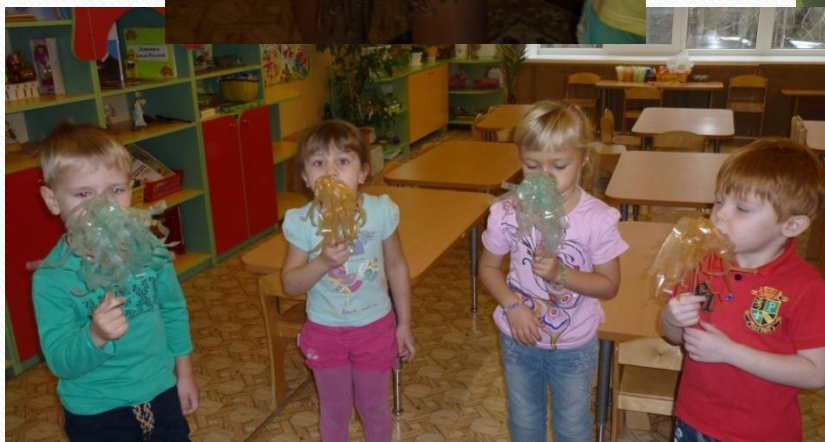
Опыты с ветром